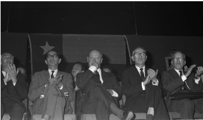
De izquierda a derecha: el diputado César Godoy, los senadores Carlos Altamirano y Volodia Teitelboim, el rector Enrique Kirberg y el senador Alberto Baltra, en el acto de clausura de la “Marcha del Presupuesto” en 1968.