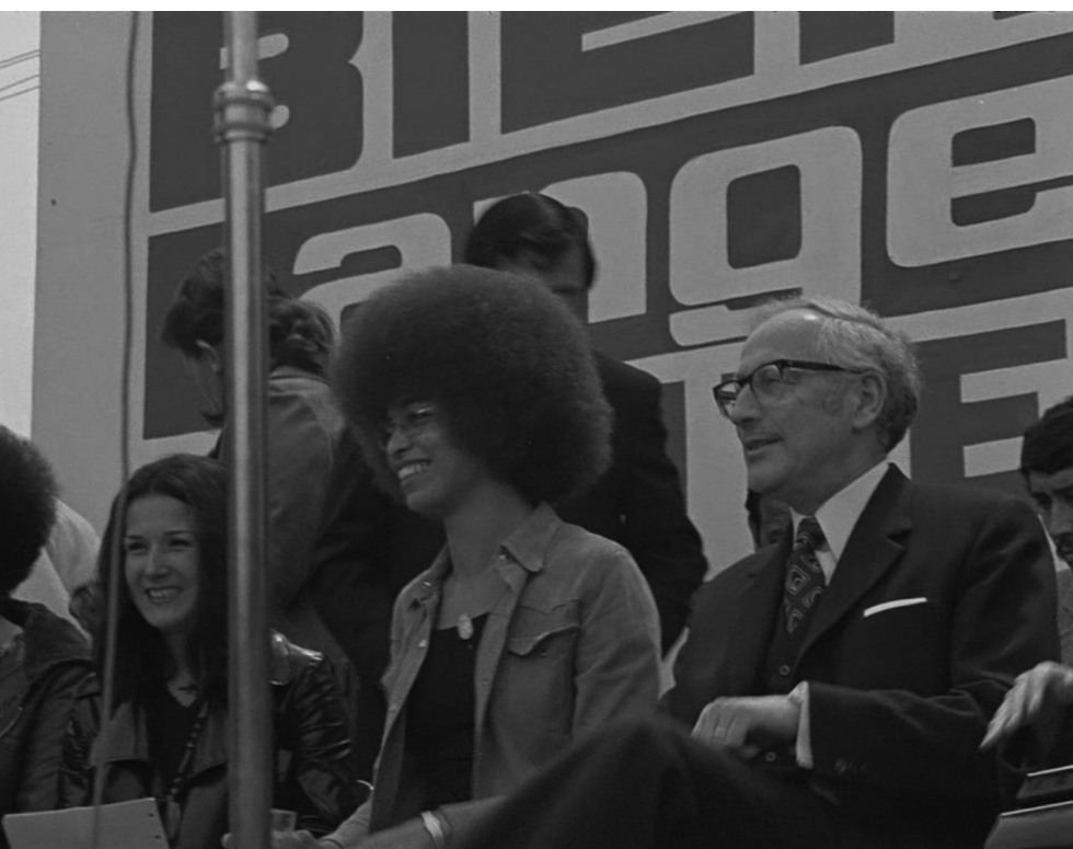
El rector junto a Angela Davis, integrante del Partido Comunista y activista estadounidense por los derechos de la mujer quien visitó la universidad en 1972.