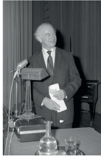
Enrique Kirberg estrechando la mano de Linus Pauling, en el marco de su visita a la UTE en 1970, donde dio una serie de conferencias. Pauling obtuvo el Premio Nobel de Química en 1954 y el Premio Nobel de la Paz en 1962 por su ardua campaña en contra del uso de energía nuclear para fines bélicos.