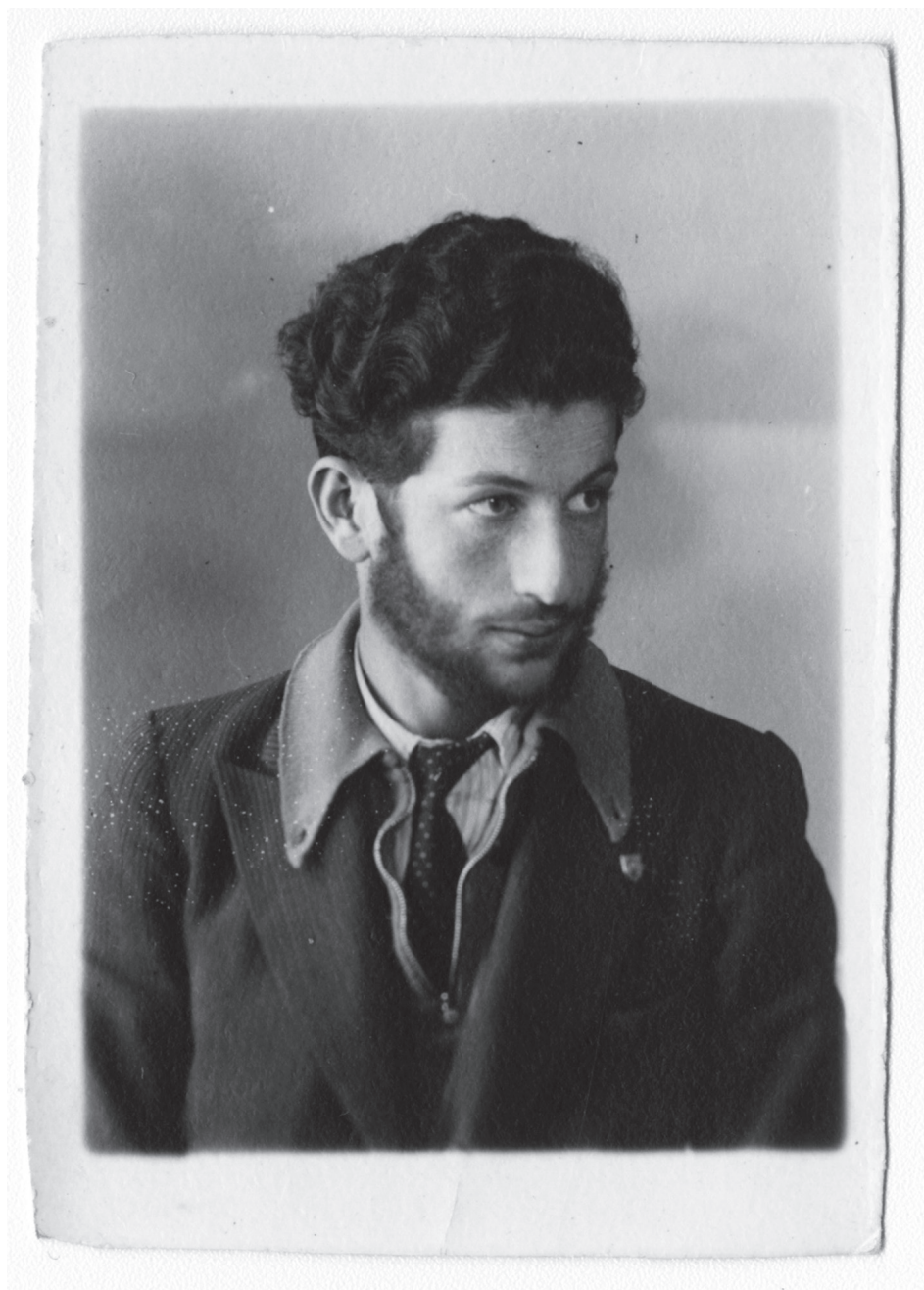
Su infancia transcurrió en varios lugares, como Quilpué y Talca, y también en Perú en Arequipa y Lima. Sin embargo, sus principales recuerdos estuvieron en Valparaíso y Quilpué. En 1929 ingresó a la Escuela de Artes y Oficios (EAO) en Santiago a estudiar Electricidad, de la que egresó a los 19 años.