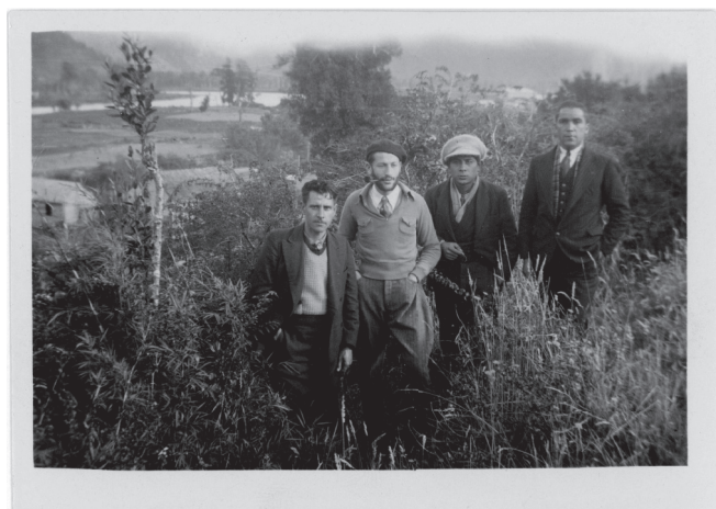
A sus 20 años, Kirberg fue relegado a Puerto Aysén en febrero de 1936 por el gobierno de Arturo Alessandri. Junto con él, cerca de 25 dirigentes políticos y sindicales corrieron la misma suerte.