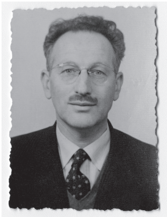
Retrato correspondiente al periodo en que surge la Universidad Técnica del Estado (UTE), luego de la creación y aprobación de su respectivo Estatuto Orgánico, y tras un arduo esfuerzo efectuado por el movimiento para su creación en el que Kirberg participó activamente.