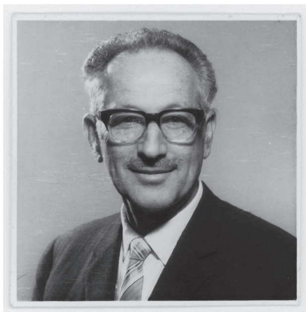
Retrato fechado el 12 de agosto de 1968. El 13 de agosto de ese mismo año fue proclamado rector de la UTE, en la primera elección donde participaron profesores y estudiantes. En 1969, fue reelecto por estudiantes, profesores y funcionarios, en la primera elección triestamental.