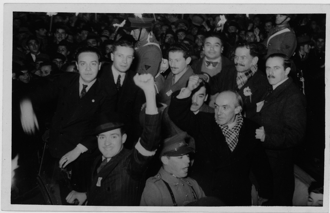
Celebración relacionada con la candidatura presidencial o elección de Pedro Aguirre Cerda. Kirberg fue partícipe de la campaña durante su estadía en Talca, donde organizó las bases del PC en la zona. Al centro de la imagen se ve a Kirberg y a su derecha a Aguirre Cerda.