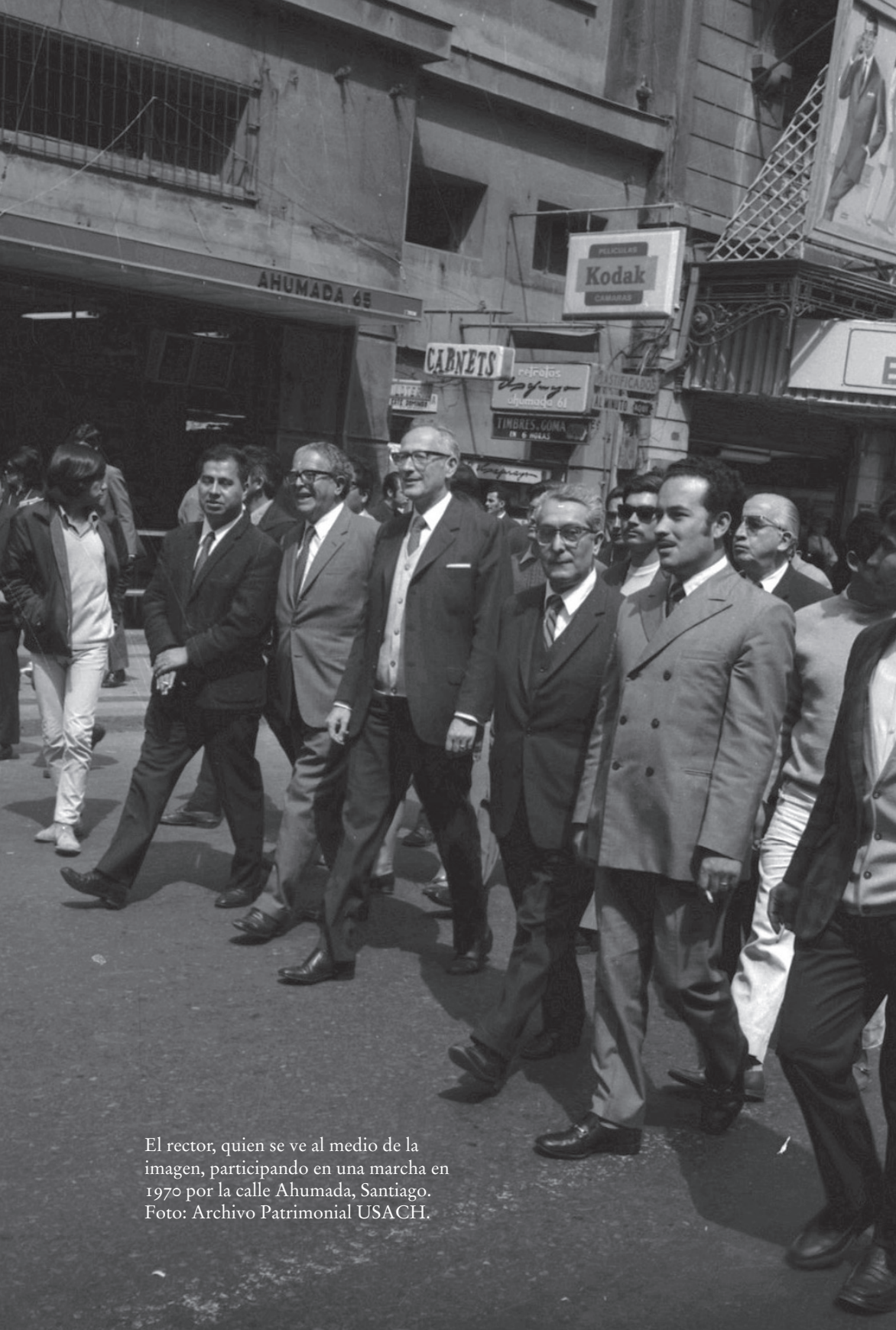
El rector, quien se ve al medio de la imagen, participando en una marcha en 1970 por la calle Ahumada, Santiago.