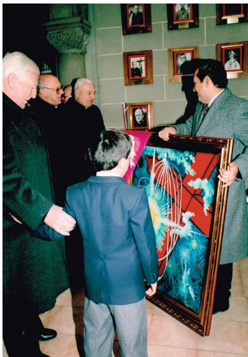
Inauguración de la Galería de Obispos Exalumnos del Colegio Sagrados Corazones con la presencia de algunos de ellos: el Cardenal Juan Francisco Fresno y los obispos Javier Prado y Eladio Vicuña. Con ellos Jaime Caiceo, que en su período como Rector se creó (1994).

plan de obras de mejoramiento de la infraestructura 34 y de la dotación de los medios pedagógicos 35 necesarios.