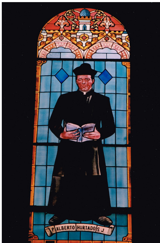
Vitral con la imagen de San Alberto Hurtado en la Capilla del Colegio de los Sagrados Corazones, mandado a confeccionar por Jaime Caiceo en 1992.

analizado. De esta forma, se pasó de una media de alumnos por curso de 27,5 a 35,2. Cada año, en forma creciente, se fue notando una mayor demanda por integrarse a esta comunidad escolar, ya que hubo entre 1993 y 1995 más de 500 postulantes para solo 180 vacantes. También, gracias a la colaboración de Mons. Sergio Valech, obispo auxiliar de Santiago y administrador del Arzobispado, se presentaron proyectos en agencias extranjeras para conseguir fondos que ayudaran a enfrentar la crisis.