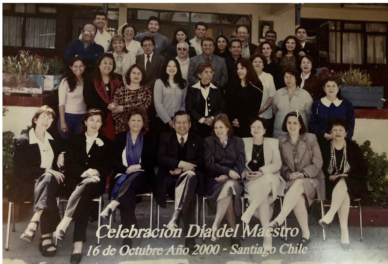
El primer año en el colegio Santa Familia junto a docentes.

gado desde Francia el 15 de marzo de 1854, y se dedicaron los primeros años al cuidado de enfermos en hospitales públicos y, posteriormente, al cuidado de niños abandonados. El establecimiento se encuentra ubicado en calle Unión Americana 151 de la comuna de Santiago. Fue dirigido por las religiosas hasta 1999, y desde el 1° de marzo del 2000 asumió la dirección y la representación legal, nombrado por la hermana visitadora —equivalente a la provincial— con el beneplácito de la superiora general residente en Francia, el Dr. Jaime Caiceo Escudero 42 . Este establecimiento es solo para niñas desde su fundación, manteniendo una matrícula de 1.120 alumnas desde kínder a cuarto año medio, con dos cursos paralelos por nivel y de la modalidad científico humanista. El valor mensual del financiamiento compartido entre los años 2000-2002 ha sido de $4.600 (año 2000), $4.750 (año 2001) y $8.000 (año 2002).