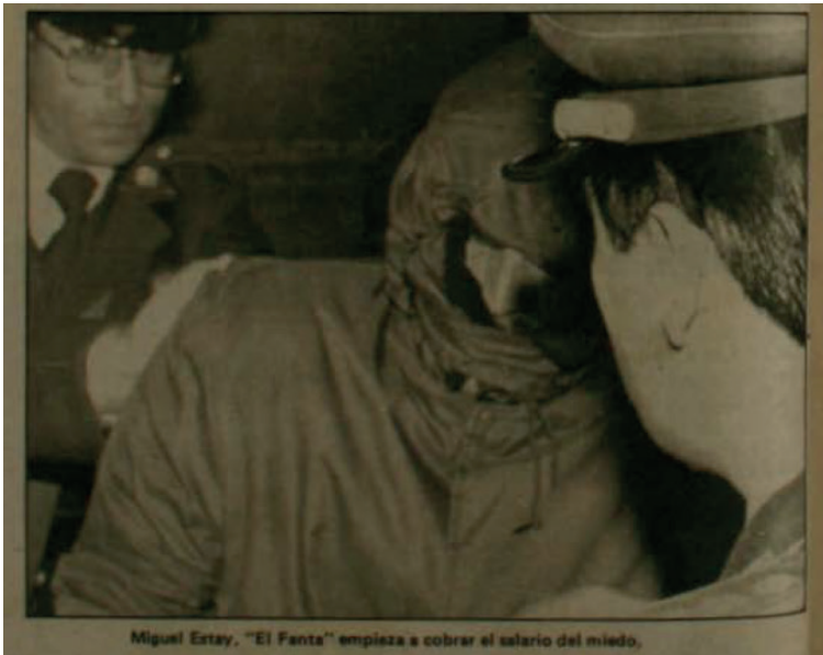
Imagen 1. Cauce 40 (1985, p. 34).

El giro final ahondaba en esa forma de la culpa, pero introduciendo un elemento que hasta el momento había carecido de centralidad: la condena a muerte por traición. En una llamativa inflexión de la voz, el reportaje recordaba esa sentencia y auguraba su cumplimiento. “Sabe perfectamente que las condenas por traición se cumplen sin apuro, pero también sin pausa, cuando la ocasión lo permite, dentro o fuera de los muros. No hay plazo que no se cumpla, ni círculo que no se cierre” (p. 36).