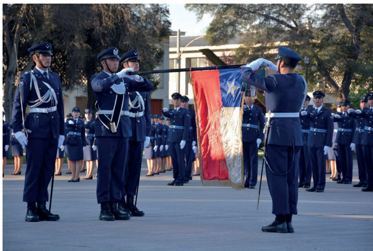
Figura 3. Juramento a la bandera. (Fuerza Aérea de Chile, 2020).

Tengo un documento firmado en la Dirección de Inteligencia de la FACH en el que se dice que todo lo que haga no debo comentarlo, y si el día de mañana me echan del trabajo, debo seguir llevando una vida normal, pero no debo involucrar a nadie. (González, 2011)