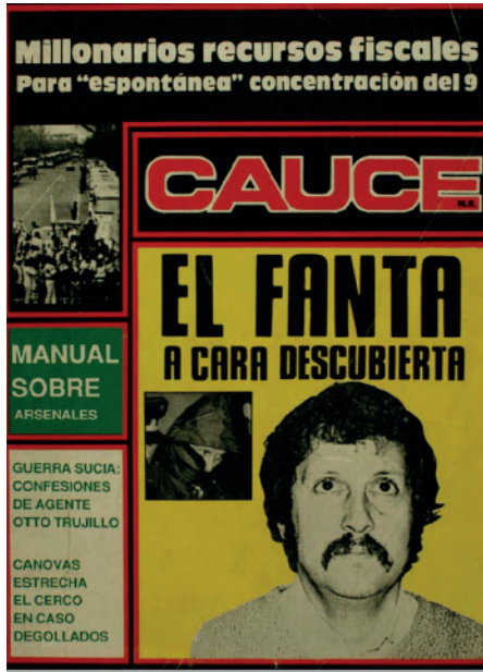
Cauce 91 (1986).

entonces, nadie, salvo miembros de los servicios de seguridad, volvió a verlo a la luz del día. Así es su aspecto físico hoy” (1986, p. 35)