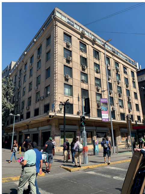
Figura 3. Inmueble base de operaciones del Comando Conjunto, en pleno centro de Santiago. Actualmente alberga el Ministerio de Bienes Nacionales.

El Comando Conjunto fue una supraorganización de inteligencia que integraba a distintas instituciones de las FF. AA. y de Orden, que funcionó de manera clandestina, entre los años 1974 y 1976 (Seguel, 2020). Su base de operaciones se situaba en pleno centro de Santiago, en un moderno edificio de grandes proporciones, llamado Juan Antonio Ríos 6 o JAR 6 (González y Contreras, 1991), Figura 3.